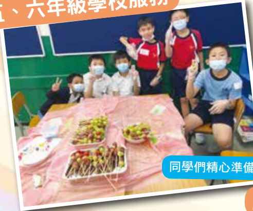
同學們精心準備食物，慰勞辛勞的老師，謝謝你們！