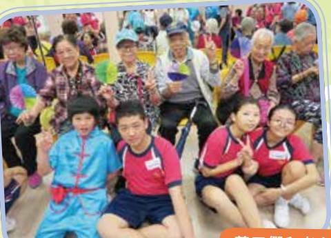
義工們和老友記一同做手工。