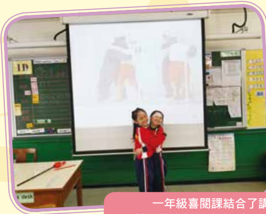
一年級喜閱課結合了講故事及戲劇元素，不但培養學生對閱讀的興趣，也啟發了學生的思考能力。