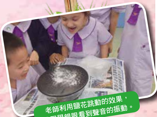
老師利用鹽花跳動的效果，讓同學親眼看到聲音的振動。