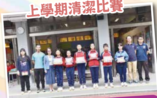
透過清潔比賽，學生養成良好個人衛生習慣，加強對學校的責任感。