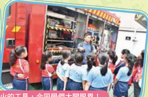
消防員為同學們介紹各種救人救火的工具，令同學們大開眼界！ 不試不知，原來這些工具是那麼重的。 透過這次實地參觀荃灣消防局，讓同學上了既真實又寶貴的一課。