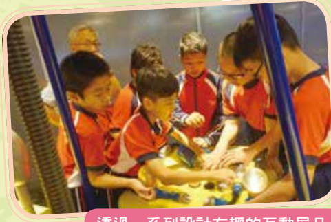
透過一系列設計有趣的互動展品，以輕鬆手法探討電與磁的原理。