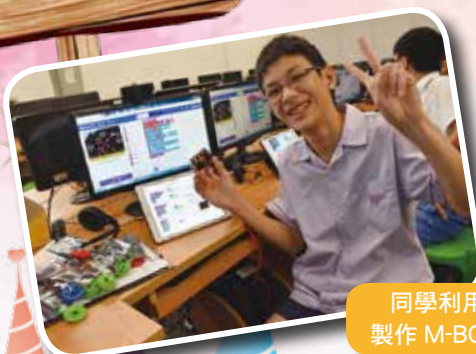
同學利用電腦軟件製作 M-BOT 機械人。