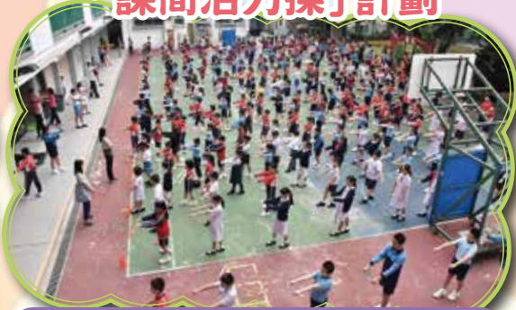
透過體育課堂及周五小息後進行的課間活力操，以增加全校學生運動的機會，保持活力，培養健康體魄，推廣運動風氣。