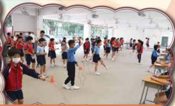
計劃目的在於讓學生認識運動有助心臟健康，並透過教授有趣的跳繩花式，鼓勵學生勤做運動。