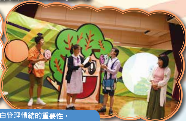
運用戲劇形式，讓學生明白管理情緒的重要性，從而建立正確的情緒管理價值觀，學生們都積極透入活動之中。