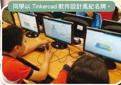
同學以 Tinkercad 軟件設計風紀名牌。