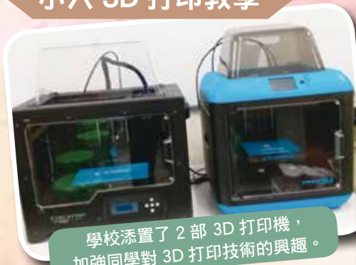
學校添置了 2 部 3D 打印機，加強同學對 3D 打印技術的興趣。