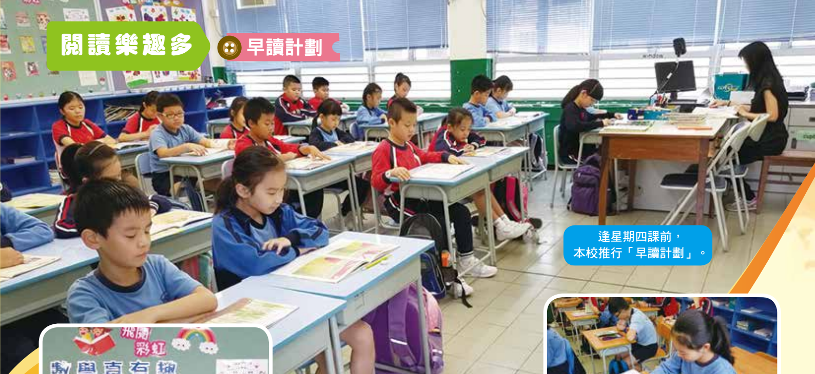
逢星期四課前，本校推行「早讀計劃」。