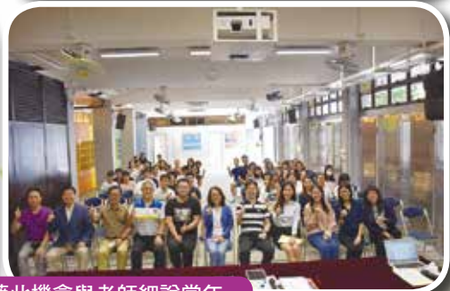
多年沒見的老同學們藉此機會與老師細說當年。