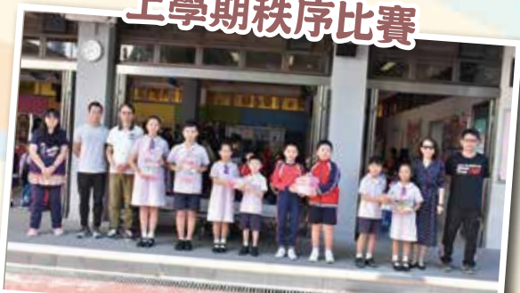
學生在遵守秩序的表現理想，培養自律守規的良好習慣