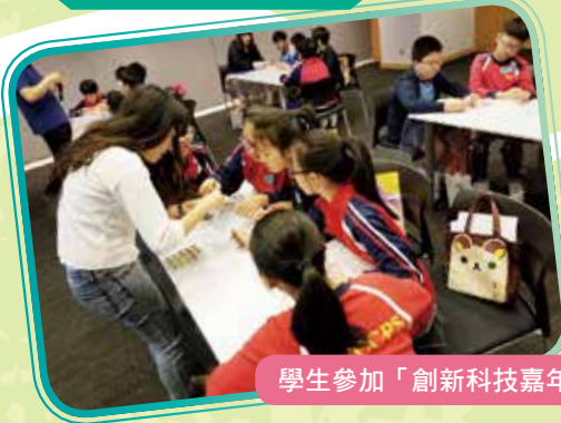
學生參加「創新科技嘉年華」，親身體驗香港於創新科技的成就及其對生活所帶來的便利與樂趣。