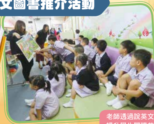
老師透過說英文故事及小遊戲，提升學生閱讀英文圖書的能力。