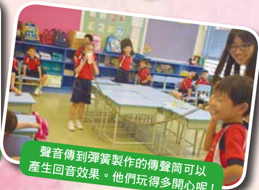
聲音傳到彈簧製作的傳聲筒可以產生回音效果。他們玩得多開心呢！