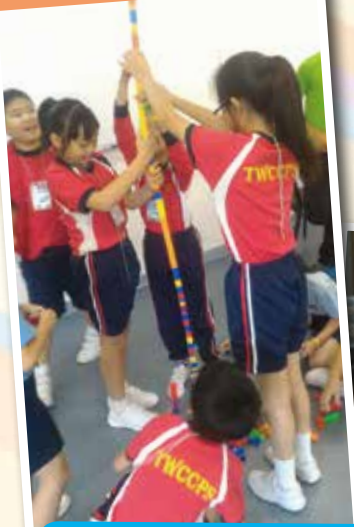
學生從活動中學習互相溝通及合作的重要性。