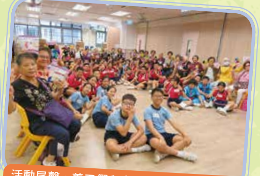
活動尾聲，義工們和老友記一同拍照留念。