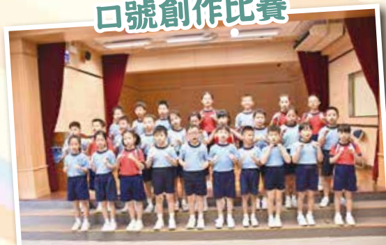
3A 班同學投入地朗讀出代表自己班的尊重口號。