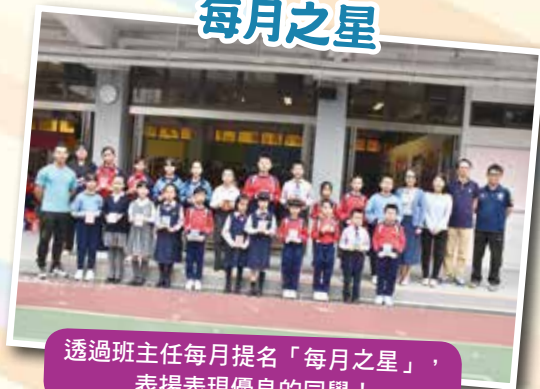
透過班主任每月提名「每月之星」，表揚表現優良的同學！