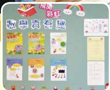
透過展板推介不同主題的圖書 / 電子圖書，學生更可於早讀時段輪流使用平板電腦閱讀電子書。