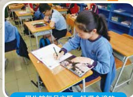
學生按每月主題，挑選合適的圖書閱讀，並完成「閱讀記錄表」。