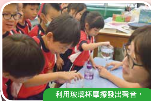
利用玻璃杯摩擦發出聲音，增添同學對聲音探究的興趣。