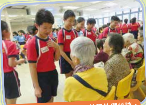
義工們向老友記介紹自己並與他們傾談。

50位六年級同學參加了學校與香港青年協會合作舉辦的義工服務計劃，透過計劃，同學們提升了個人的能力感，也讓他們認識到與人合作的重要性。